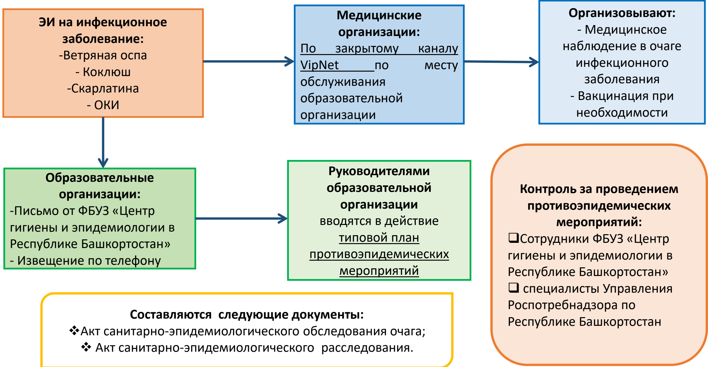
Схема передачи информации в очагах инфекционных заболеваний